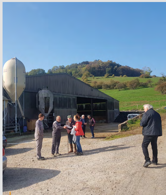
12 octobre 2022 rencontre entre exploitants agricoles, élus et techniciens de la Chambre d'agriculture et de la Communauté de communes.

Ces aspects seront approfondis lors des rencontres avec tous les exploitants dans les prochains mois.