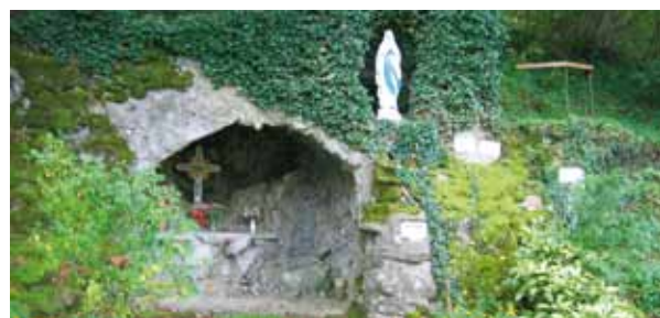
La grotte de Mignafans fut érigée en 1912

Le village possède deux belles fontaines, mais l'élément le plus marquant est sans