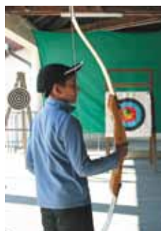
Initiation au tir à l'arc à Villersexel

L'équipe se compose de 2 permanents, trois personnes pour le midi, complétée de 2 à 4 animateurs pendant les vacances scolaires.