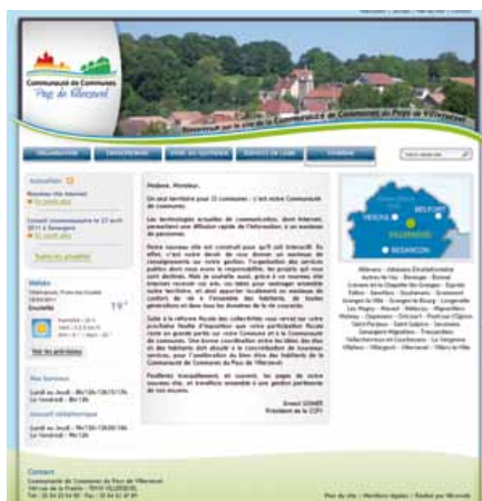
Une nouvelle charte graphique pour le site Internet de la CCPV

Entreprises : www.cc-villersexel.fr Rubrique Entreprendre / Les entreprises