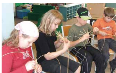
Activité vannerie : réalisation d'un dessous de plat à Esprels