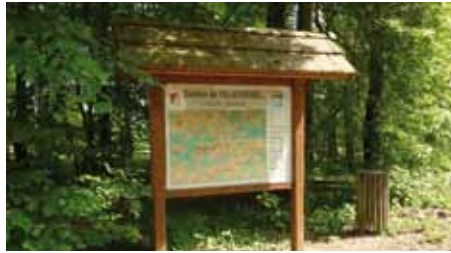
Relais Info Service dans la forêt de Villersexel

Ces projets sont le fruit d'une réflexion menée par le Comité d'Exploitation de l'Office de Tourisme. Depuis la dissolution de l'association en juin 2010, ce comité, composé de membres du conseil communautaire et