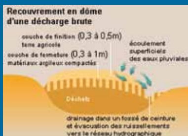
Vue de profil