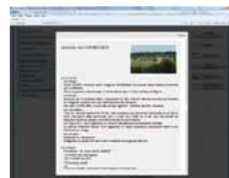
Une fiche détaillée des annuaires