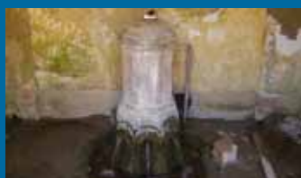
→ La source de Velleminfroy