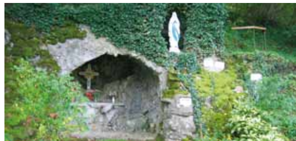
La grotte de Mignafans fut érigée en 1912

Le village possède deux belles fontaines, mais l'élément le plus marquant est sans