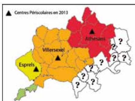
Après Esprels, Villersexel et Athesans, la CCPV envisage un quatrième centre dans sa partie Est-Sud-Est de son territoire (en blanc sur la carte).

Pour couvrir totalement son territoire, la CCPV envisage la construction d'un quatrième centre dans sa partie est-sud-est. Ainsi les attentes de toutes les familles de la CCPV seront satisfaites à travers ce service de proximité.