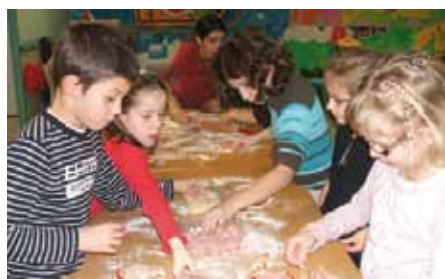
Activité culinaire : j'apprends à faire une pizza à Esprels

Les inscriptions sont possibles tout au long de l'année, pour les enfants scolarisés de 3 à 11 ans.