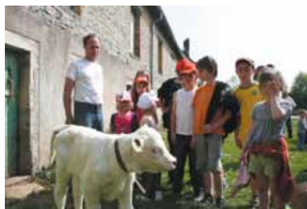
Visite aux animaux d'une ferme à Villersexel

Cette année, le centre d'Esprels sera ouvert, pour test, pendant les grandes vacances du 04 au 29 juillet 2011. Vous pouvez vous renseigner sur le programme auprès de la directrice (voir coordonnées des centres page de droite).