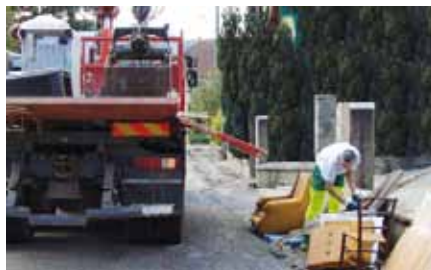
Collecte des encombrants 2010

Les matériaux volumineux collectés sont identiques à ceux acceptés en déchetterie. Un doute, une question ? contactez le SICTOM !!!