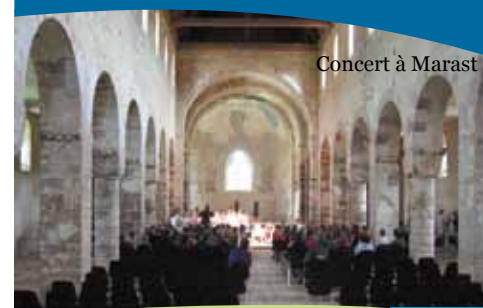
Concert à Marast

Retrouvez toutes les manifestations sur le site www.ot-villersexel.fr Rubrique Manifestations