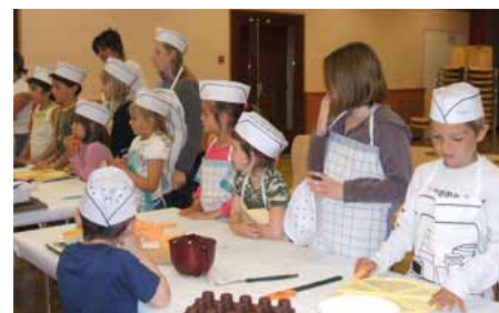
Je cuisine avec maman : réalisation de croissants aux chocolats à Esprels