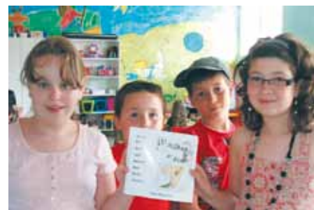
Création du livre « Les inséparables en Afrique »