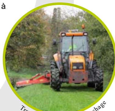
Tracteur équipé pour le fauchage

Il permet aussi de jouer pleinement la carte de la solidarité avec les petites communes qui ne possèdent ni personnel communal ni matériel. Ces agents effectuent en ce sens une véritable mission de service public à destination des usagers.