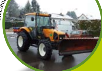
Tracteur équipé pour le déneigement

et la mise à disposition de moyens techniques. Elle dispose d'un tracteur équipé d'une lame de déneigement et d'une saleuse. L'équipe technique est d'astreinte du 16 novembre 2015 au 13 mars 2016 . La CCPV fait appel en plus à un prestataire via un marché public. C'est l'entreprise BILLOTTE de Granges-le-bourg qui a été retenue cette année.