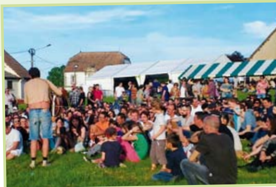
Un public varié et nombreux a pu assister aux spectacles et animations proposés.

L'objectif était de confier l'organisation à une association locale, ce qu'a très bien fait BLED ART en tant que metteur en scène du programme culturel de cette journée et de l'organisation logistique. Le budget était de 10.000 € dont 6.000 € de la communauté de communes et 4.000 € du Département.