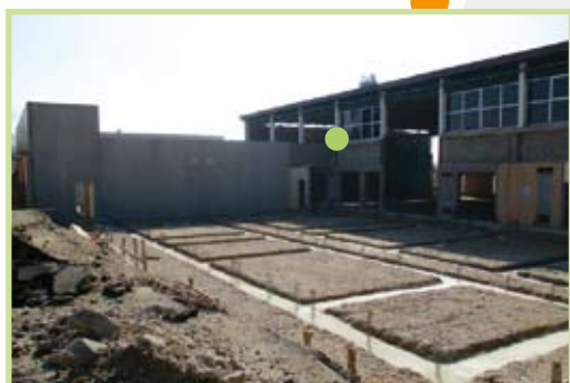
Les travaux du gymnase de Villersexel avancent