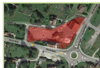
Le CTI s'installera rue des Vosges

Le marché public pour le programme pluriannuel de travaux de voirie communautaire 2016-2018 a été attribué au groupement COLAS VAUGIER.