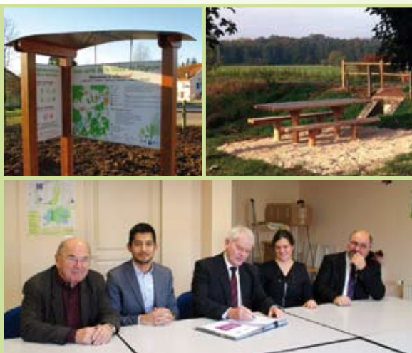
Signature avec SNCF réseau