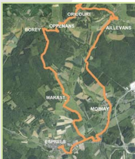
Tracé du sentier du Moyen-âge

Aujourd'hui, il est nécessaire de retenir un maître d'œuvre afin de définir précisément les interventions à mener sur chaque élément du patrimoine. Le lancement d'une consultation en vue de retenir un maître d'œuvre est prévu : il réalisera un cahier des charges technique et suivra les travaux.