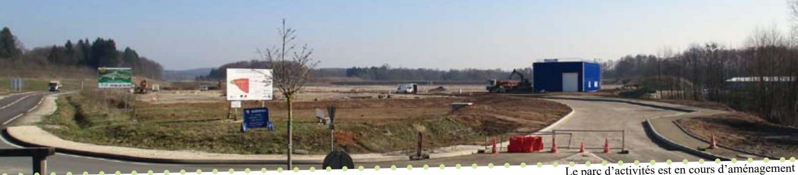
Le parc d'activités est en cours d'aménagement