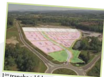
1 ère tranche : 15 lots sont disponibles

Les travaux du Parc ont débuté au cours du mois de novembre 2015. L'installation des réseaux humides est effectuée. Les travaux de voirie et des réseaux secs sont en cours.