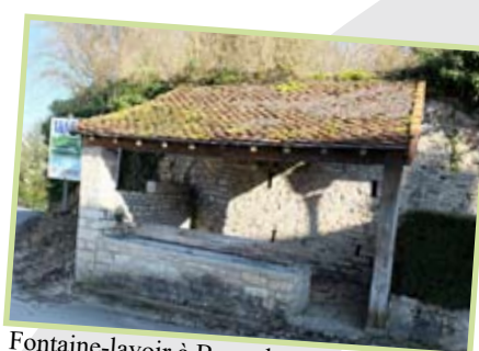
Fontaine-lavoir à Bonnal

Les tables de lecture seront installées au printemps 2016.